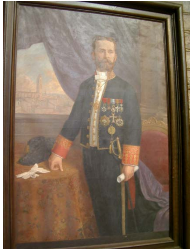
Eduard Toda i Güell en la seva etapa de diplomàtic [ www.ca.wikipedia.org/wiki/Eduard_Toda_i_G%C3%Bcell ]

meix una monografia a causa de la demanda del mercat. També hem de dir que és la cinquena monografia que s'esgota. La Junta de Govern valora molt positivament l'acceptació de les seves publicacions, atinent a les reduïdes dimensions del territori on treballa: la comarca de la Conca de Barberà._