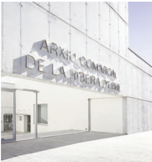
Façana de l'Arxiu Comarcal de la Ribera d'Ebre orientada al vial que condueix a l'Hospital Comarcal de Móra d'Ebre. Autor: J. Orpinell

A l'hora de mirar enrere i de valorar la tasca duta a terme per l'ACRE dividirem la nostra anàlisi en tres grans camps. Primerament, els serveis a les administracions públiques de la Ribera d'Ebre; en segon lloc, la captació, gestió i tractament arxivístic del fons amb més valor patrimonial i cultural de la comarca, i, en darrer lloc, les activitats relacionades amb la difusió del patrimoni documental que gestionem i l'explicació de les nostres funcions entre la ciutadania.