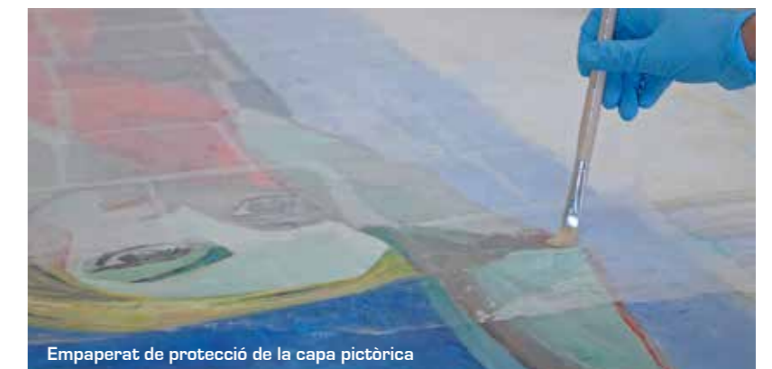
Empaperat de protecció de la capa pictòrica

Amb la finalitat de protegir la pintura durant les següents intervencions es va tornar a empaperar i es va aprofitar la humitat aportada per fer una primera correcció de les deformacions.