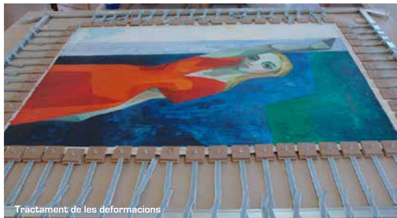
Tractament de les deformacions

Els plecs i les ondulacions es van eliminar tensant la pintura en un bastidor provisional d'angles extensibles. El fet d'obrir progressivament aquest bastidor és el que va facilitar l'eliminació de les deformacions. Aprofitant que la tela estava subjectada al bastidor provisional es va desempaperar la capa pictòrica.