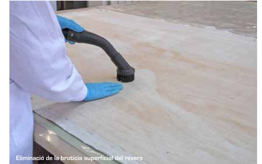
Eliminació de la brutícia superficial del revers

Sembla ser que la pintura no va ser envernissada cosa que ha fet que la pols i la brutícia s'hagi anat dipositant sobre la superfície pictòrica.