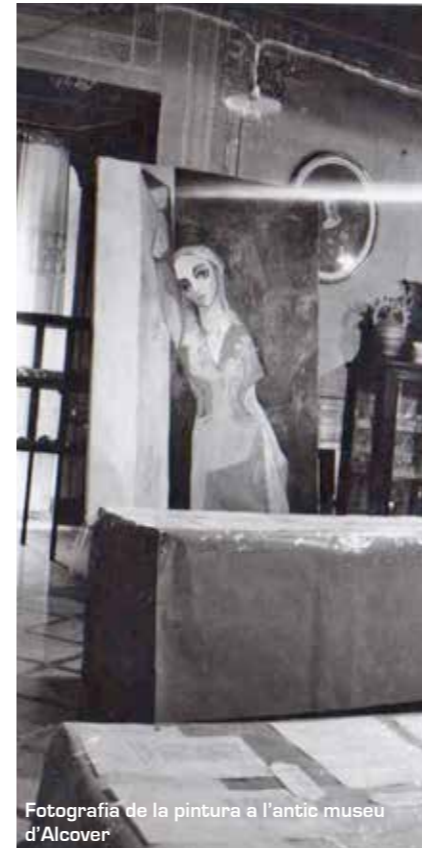
Fotografia de la pintura a l'antic museu d'Alcover

Una vegada estudiada l'obra i les problemàtiques que presentava, es va decidir seguir el criteri de la mínima intervenció, creient que s'havien d'acceptar les alteracions sofertes, i tractar-les des del punt de vista conservatiu.