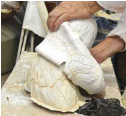
Es trau la reproducció amb guix

La reconstrucció del rostre i mans es va realitzar mitjançant el sistema d'original-motlle-reproducció que consisteix a modelar el cap i mans amb fang vermell cru i traure un motlle de silicona del negatiu, per, a continuació, traure la reproducció amb guix i unir-lo a l'escultura.