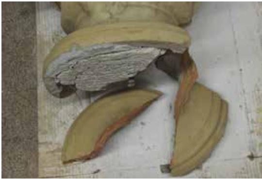
Fragmentació de la peanya