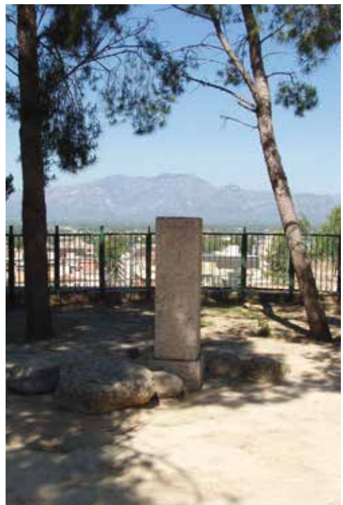
Pedestal on estava situada la peça