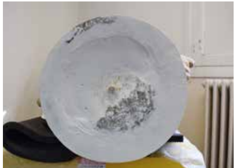
Base de la peanya omplerta amb guix

Per a estabilitzar l'escultura es van fixar els fragments de la peanya i es va reomplir amb guix per aconseguir una base anivellada i estable per a sostenir dempeus la figura.