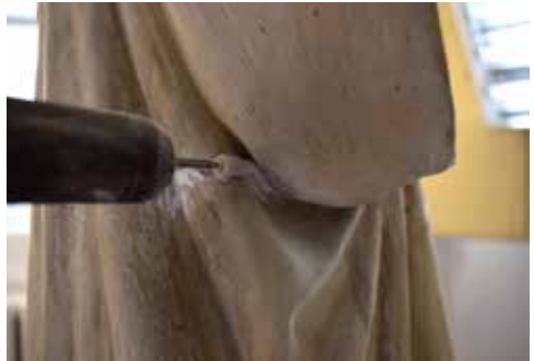
Neteja mecànica amb micromotor

La neteja mecànica es va fer amb micromotor per a rebaixar el material sintètic dur que sobresortia de l'esquerra horitzontal que parteix la figura transversalment. Aquest procés es va realitzar amb molta precisió per evitar erosionar el fang.