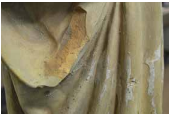
Dipòsits d'una resina sintètica