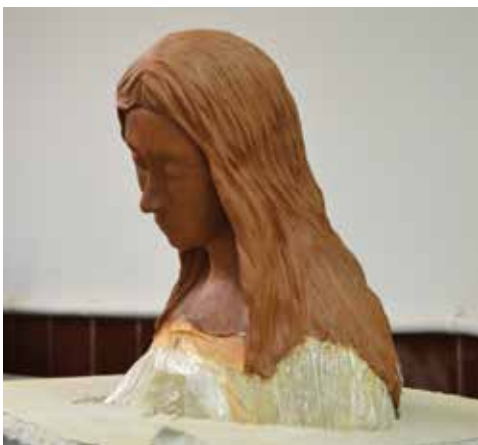
Reconstrucció del cap amb fang cru

El rostre i les dues mans són elements essencials i rellevants de l'obra, sense ells la imatge perd el seu valor i sentit. Per aquest motiu va ser necessària la seva reconstrucció. No obstant això, atès que no es tenia cap informació suficientment vàlida sobre la imatge original, es va crear una representació nova, diferenciadora, que va permetre la recuperació de la unitat de l'obra i, al mateix temps, mostrar que l'afegit no pertany a la mateixa època que l'original.