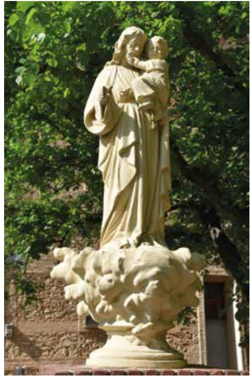
Imatge de Sant Josep

Es desconeix l'autoria d'aquesta peça; no obstant això, s'ha trobat semblança amb una imatge de Sant Josep ubicada als jardins de la Biblioteca Municipal Mercè Lleixà de Roquetes (Tortosa). Les dues imatges són molt similars pel que fa a la seva morfologia i dimensions, la qual cosa apunta al fet que podria tractar-se de dues obres escultòriques realitzades pel mateix artista o taller.