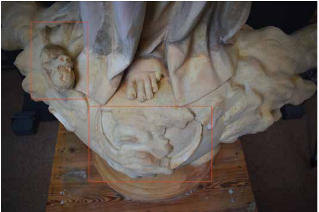
Elements iconogràfics de la Immaculada que apareixen a la peanya i fan referència a la victòria sobre el pecat original

La imatge de la Immaculada Concepció de la Verge fa referència a la virginitat perpètua de la Mare de Déu. Està representada de cos sencer, dempeus sobre una peanya rodona amb núvols i la lluna creixent. Vesteix una túnica llarga i a sobre porta un mantell, símbols de puresa i d'eternitat. Als peus de la Immaculada apareix una serp o drac amb una poma a la boca que simbolitza el seu domini sobre el pecat original. Les mans estaven col·locades davant del pit amb posició de pregària, com es pot apreciar en nombroses representacions de la Immaculada.