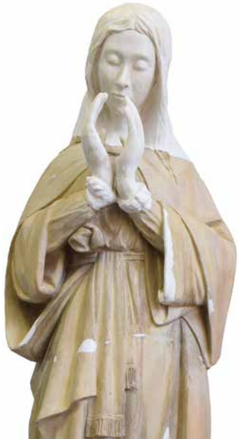
Resultat de la reconstrucció de rostre i mans

La reconstrucció del rostre i mans es va realitzar mitjançant el sistema d'original-motlle-reproducció que consisteix a modelar el cap i mans amb fang vermell cru i traure un motlle de silicona del negatiu, per, a continuació, traure la reproducció amb guix i unir-lo a l'escultura.