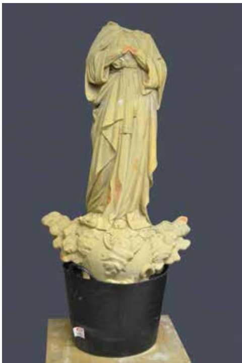
Estat inicial de l'obra

La Immaculada Concepció, propietat del Col·legi Immaculada de Tortosa, és una donació que varen fer els alumnes de la promoció 43-44. Des de llavors ha estat ubicada als jardins de l'edifici Seminari de Tortosa i ha estat testimoni de totes les celebracions de les successives promocions. Fins que, en 2010, va ser víctima d'un acte vandàlic. Es va fer caure a terra, se'n va fragmentar la peanya i van desaparèixer el cap i les dues mans, fet que va hipotecar la integritat de l'obra i la va deixar en un estat de conservació molt greu.