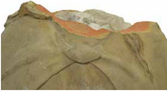
Pèrdua del cap