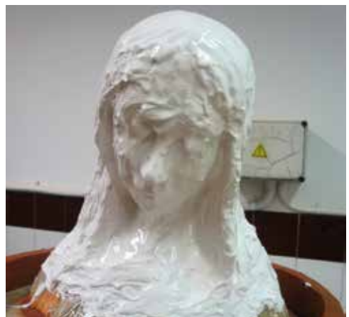
Elaboració del motlle amb silicona