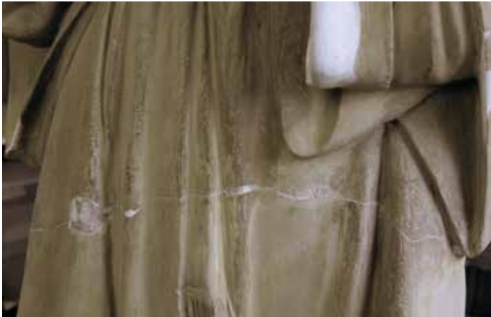
Esquerda horitzontal que rodeja tota l'escultura

També es pot apreciar que l'escultura presenta una fractura transversal que passa per davall de les mànegues de la vestimenta i parteix la figura en dos. Aquesta fractura es desconeix si és a causa del sistema d'elaboració o es va produir posteriorment. Sigui com sigui aquesta alteració va ser esmenada amb l'aplicació d'un material sintètic adhesiu.