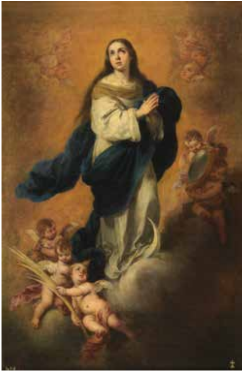
Immaculada Concepció de Murillo, any 1660 a 1665, oli sobre llenç, 206 x 144 cm, Museu del Prado (Madrid)