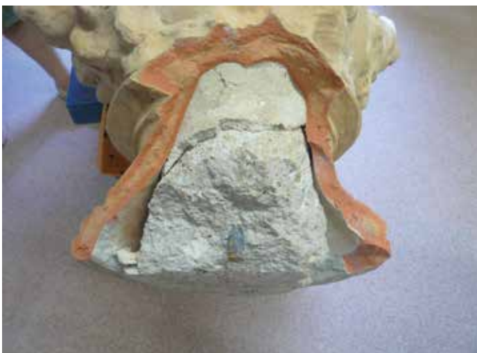
Detall del formigó present dintre de la peanya on també s'aprecia la barra de ferro

L'espai interior de l'escultura es troba parcialment omplert amb un ànima* de formigó i una barra de ferro. És per això que tal quantitat de material proporciona al conjunt un pes considerable. Probablement, aquests materials es van afegir quan es va situar la peça als jardins de l'escola amb l'objectiu de proporcionar-li major estabilitat i una ferma subjecció. La barra de ferro central s'introduïa uns centímetres al pedestal de pedra, on estava situada la peça, i aquesta va quedar partida durant l'acte vandàlic.