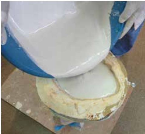
S'ompli el motlle de silicona amb guix