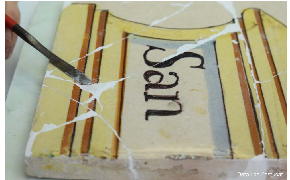
Detall de l'estucat

Aquesta es va dur a terme amb estucs* compatibles amb la terrissa original i reversibles, després es va envernissar per tancar els porus i preparar la superfície per rebre la reintegració de la policromia.