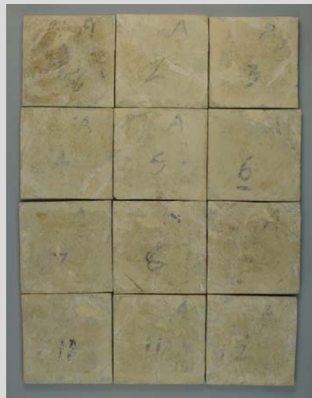
Fotografia final revers