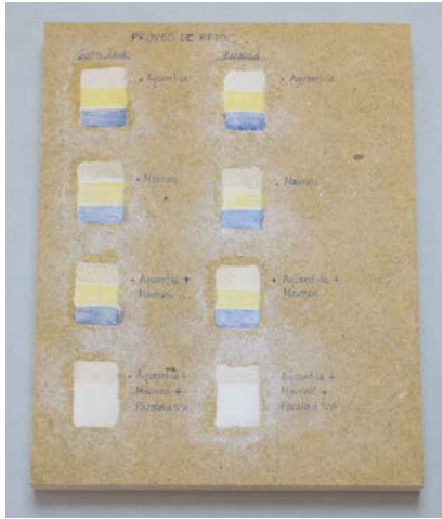
Proves de color

Finalment en el retoc cromàtic, després de realitzar proves de color, es va optar per realitzar un puntillisme * mimètic per sobre. Amb aquesta tècnica se li retorna la unitat estètica a la peça alhora que permet diferenciar les parts restaurades de les originals, respectant el valor historicoartístic i sense crear falsos històrics. A partir de la reproducció * es va poder reconstruir el dibuix per complet.