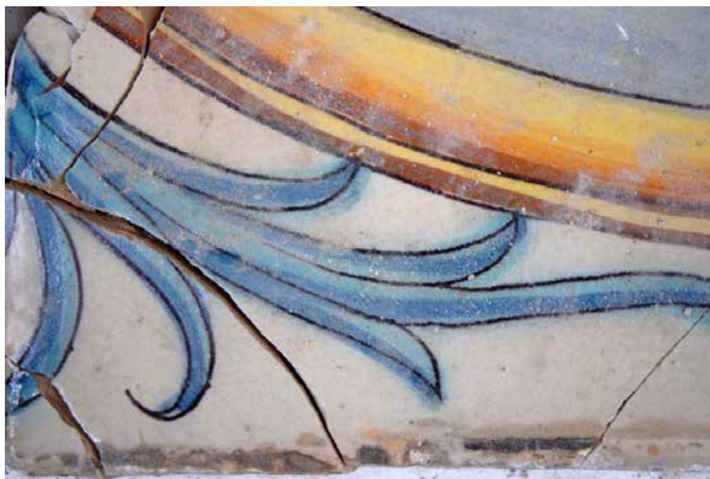
Detall de manufactura

Això s'evidencia en la irregularitat de les peces de ceràmica, així com les clares pinzellades que s'observen als detalls de la pintura. També s'identifica diversos defectes de tècnica com taques de pigment en zones de fons de la imatge o bé discontinuïtat de les tintes pels diferents gruixos d'aquestes durant l'aplicació i els efectes que ha produït la posterior cocció.