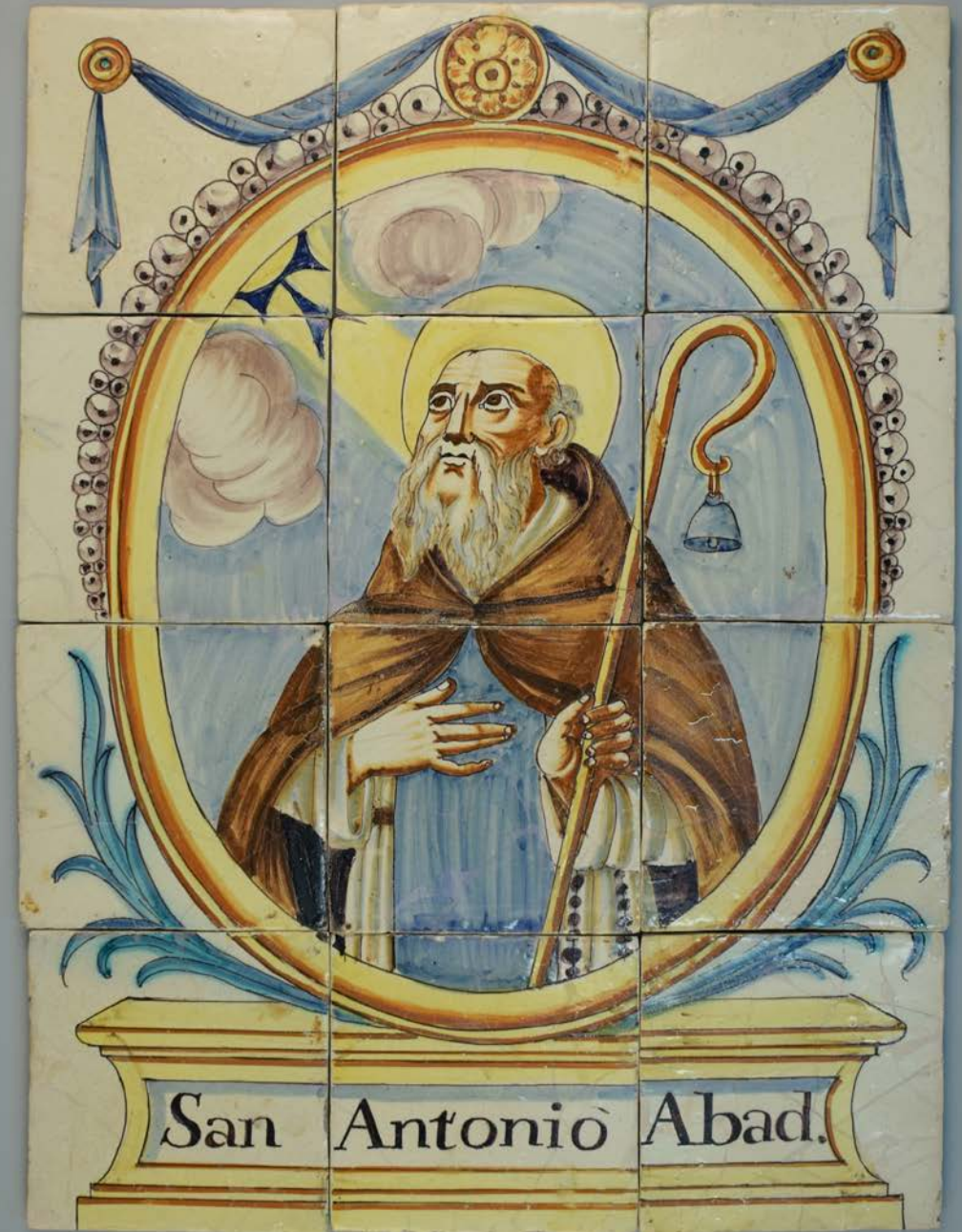
Fotografia final anvers