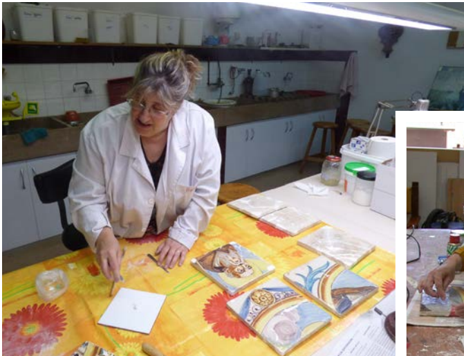
Alumnes de restauració adherint i netejant els fragments

La primera fase de la intervenció es va iniciar a les aules de conservació-restauració de l'Escola, on les alumnes d'etnologia van netejar mecànicament el morter del revers i van reordenar els fragments de l'obra per adherir-los i retornar la unitat artística a cada rajola del Plafó.