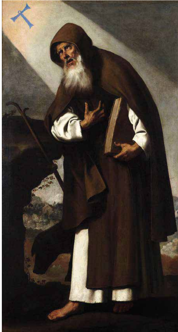
Elements iconogràfics de Sant Antoni Abat

El plafó representa sant Antoni Abat dintre d'una orla ovalada i ornamentada amb motius orgànics, que es recolza sobre una peanya on hi ha escrit el nom "San Antonio Abad." La imatge apareix amb els atributs típics que l'acompanyen: l'aurèola, el bàcul amb una campaneta i un rosari penjat al cinturó. Malauradament no s'ha trobat l'autoria de l'obra, ni cap marca de fabricació a les rajoles que pogués indicar qui el va poder encomanar o bé la data exacta que es va incloure als murs del portal de Sant Antoni.