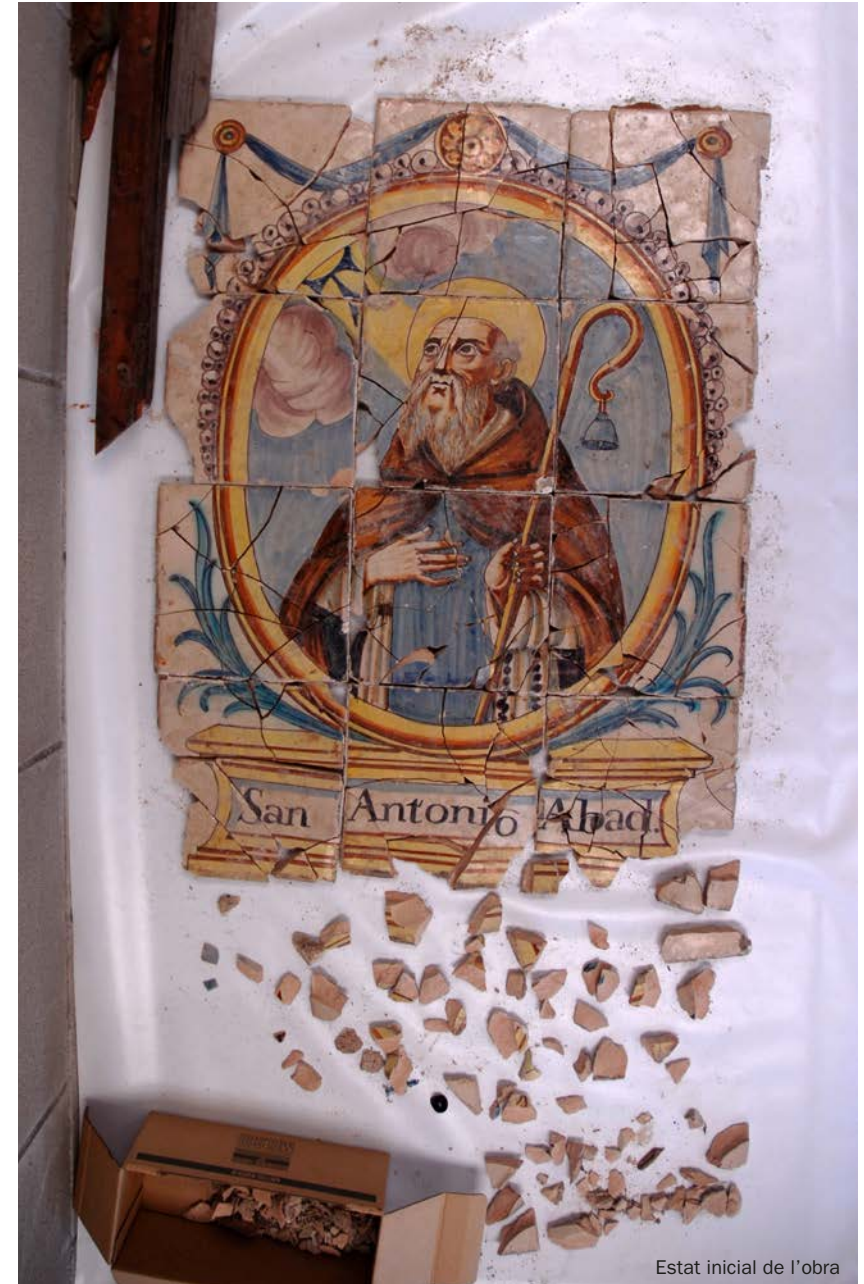
Estat inicial de l'obra