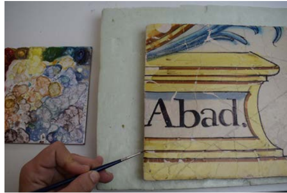
Efecte estètic de la reintegració a puntillisme