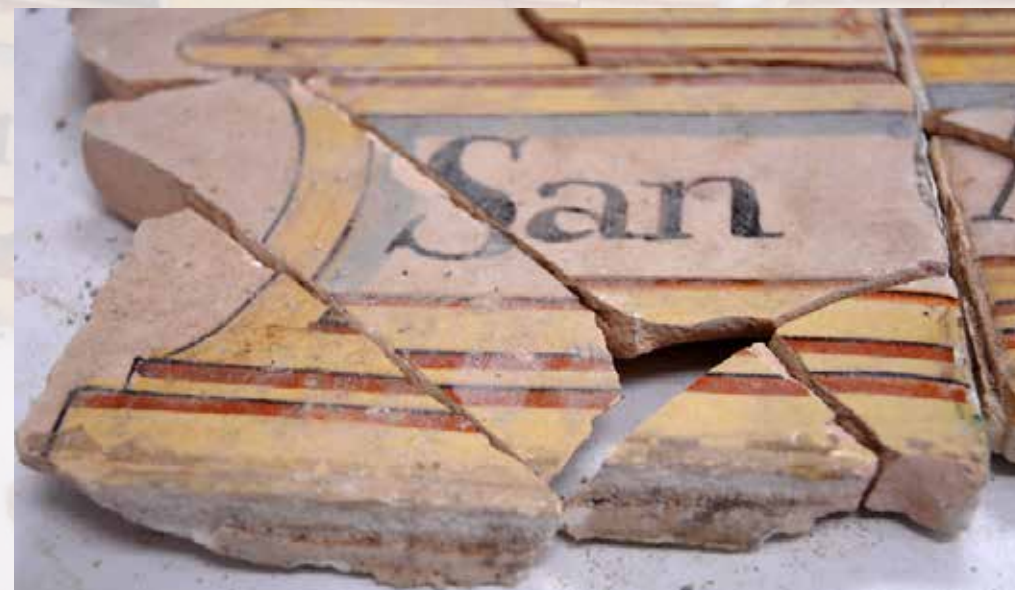
Perfil d'una rajola on es perceben pèrdues

El percentatge de pèrdues causades per l'acte vandàlic, el trencament de les rajoles, les concrecions de morter original del revers i les condicions del marc perforat pels insectes feien que l'estat de conservació de l'obra fos força greu.