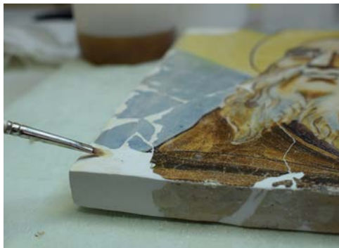
Estrat de protecció/intervenció