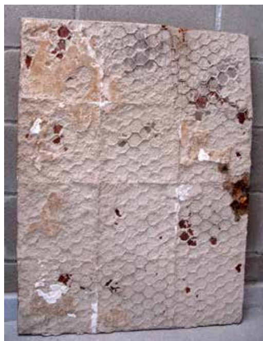
Suport original després

A banda d'això, en diversos llocs trobem el revers de les rajoles ocult sota una capa del morter* que la fixava al suport de fusta conglomerada original, recobert per una malla de filat metàl·lic.