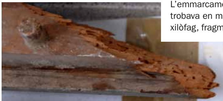
Estat del marc

L'emmarcament també de fusta, es trobava en molt mal estat per atac xilòfag, fragmentació i brutícia.