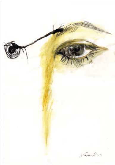
A lo millor soc un monstre Tinta xinesa, aquarel·la i retolador 29,7 cm x 40 cm