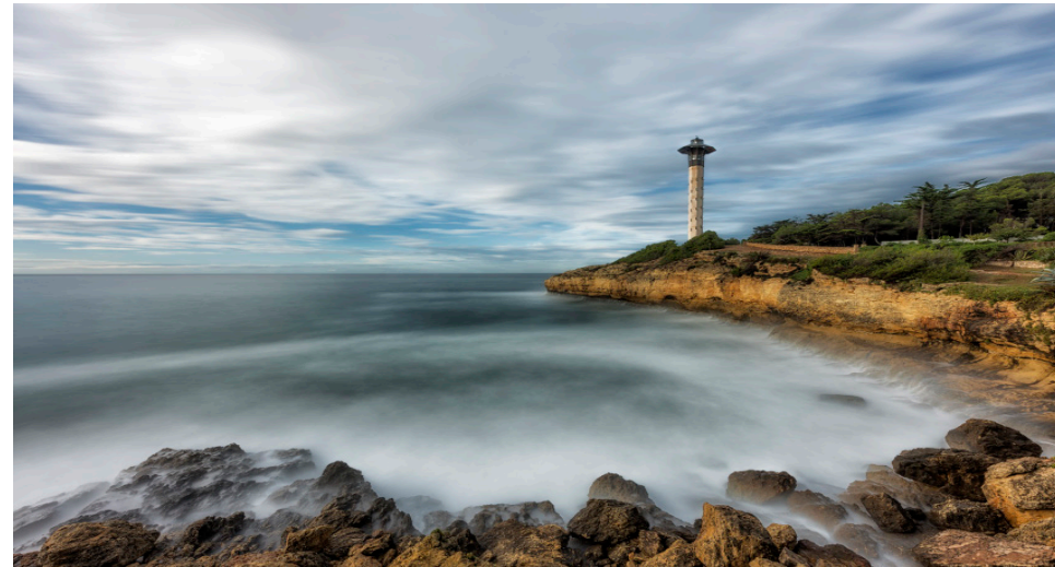
Far de Torredembarra. 60 x 40 cm