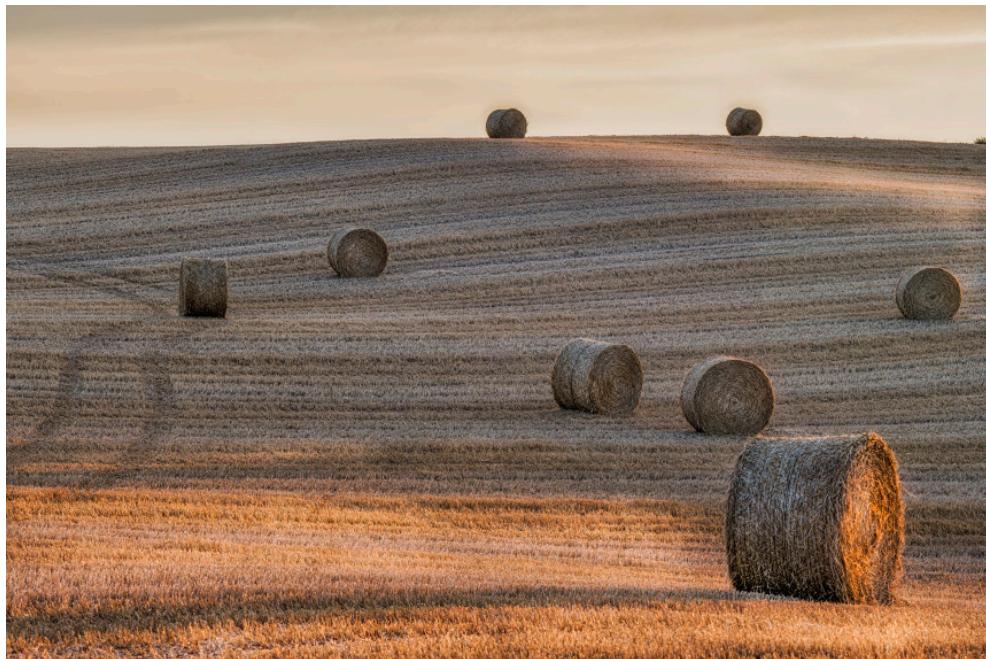
Línies i cercles a la Conca de Barberà. 60 x 40 cm