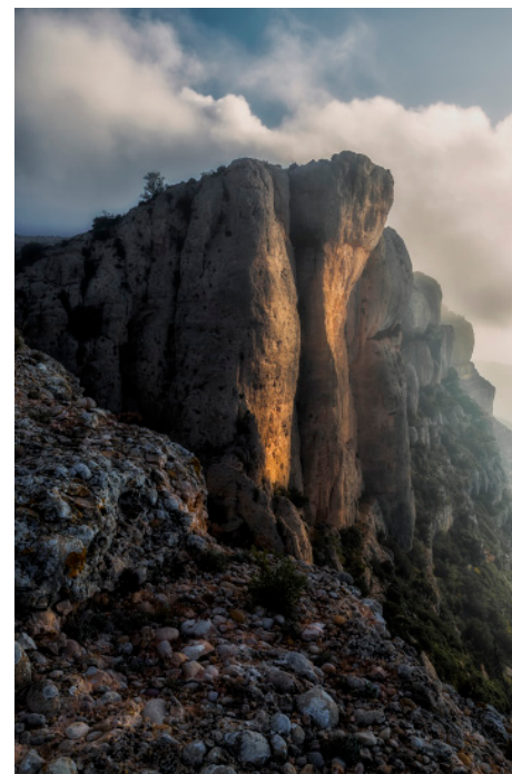
La Roca Falconera. 60 x 40 cm