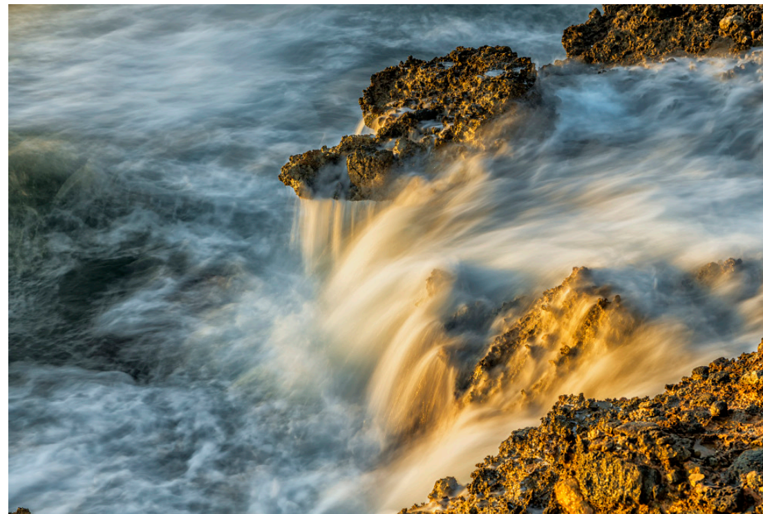
Roques de l'Estany (II). 50 x 33 cm