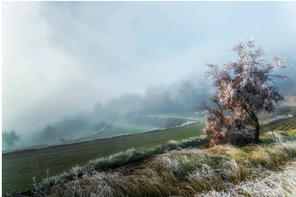
Boira i fred a la Conca de Barberà. 60 x 40 cm