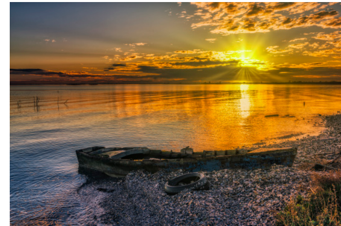
Badia del Fangar. 60 x 40 cm