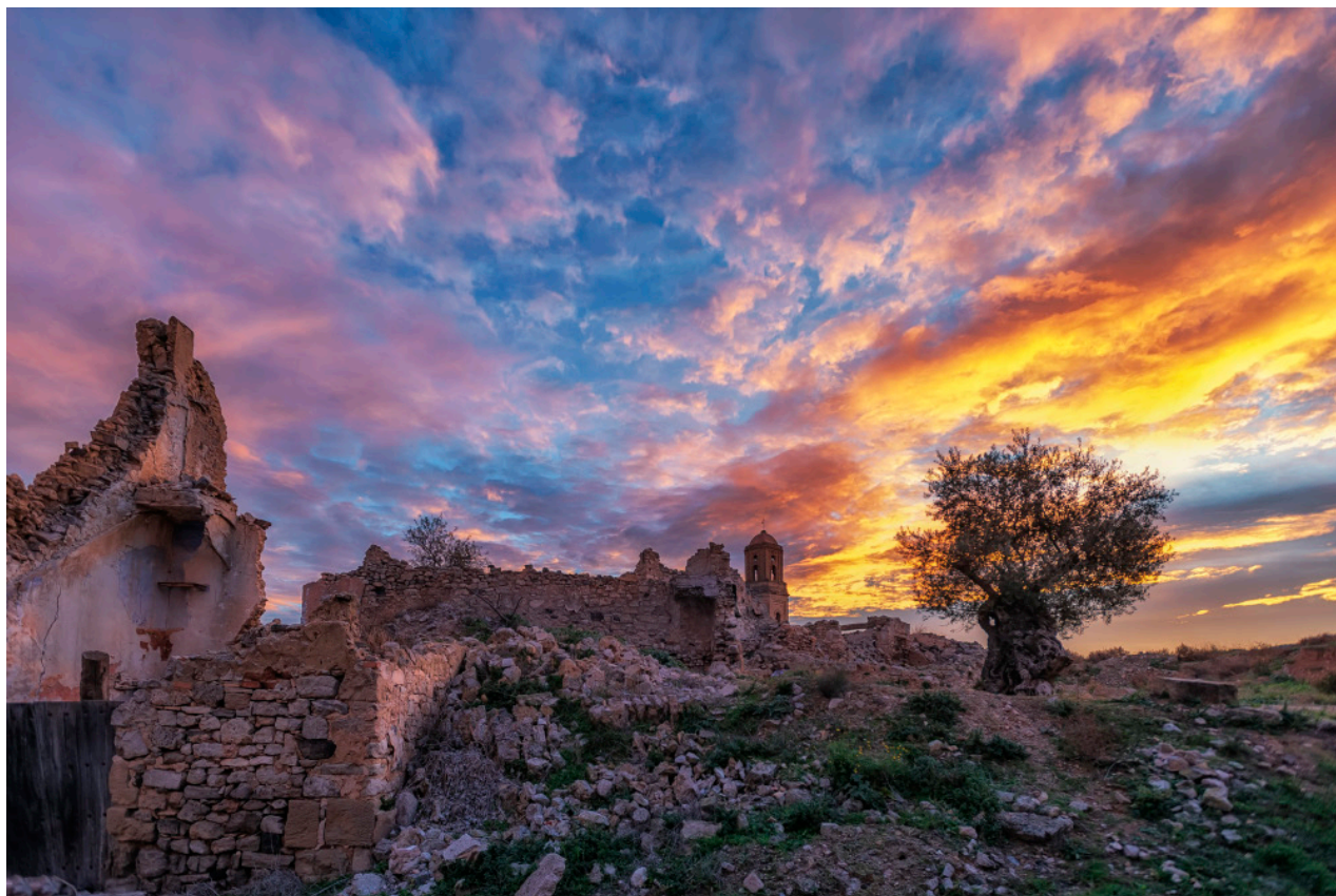
Poble Vell de Corbera d'Ebre. 60 x 40 cm