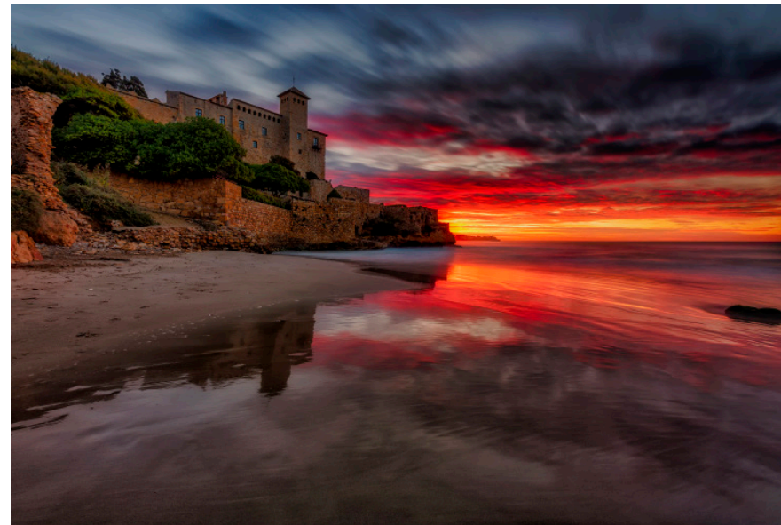
Castell de Tamarit. 60 x 40 cm