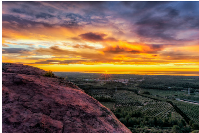
Vista des de l'Ermita de la Mare de Déu de la Roca. 50 x 33 cm