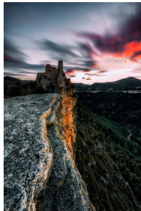
Castell de Siurana. 60 x 40 cm