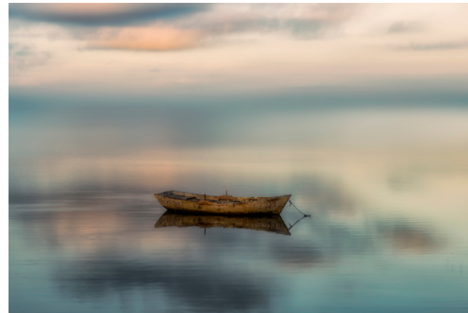
Badia dels Alfacs. 60 x 40 cm