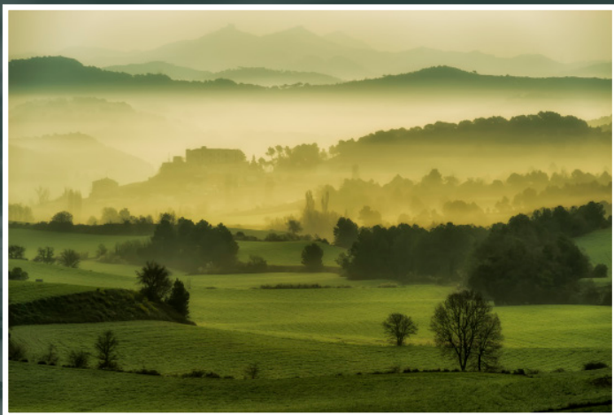
Camí a Vallespinosa. 60 x 40 cm