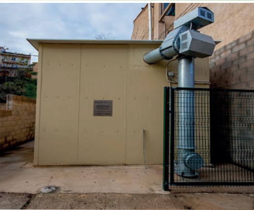
HORTA DE SANT JOAN