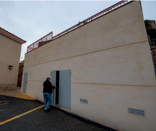
VANDELLÒS I HOSPITALET DEL INFANT