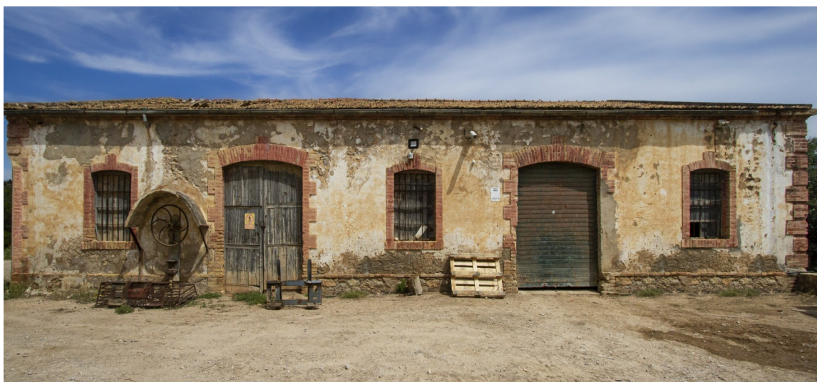
Xalamera (Benifallet). Autor: Ramon Cornadó