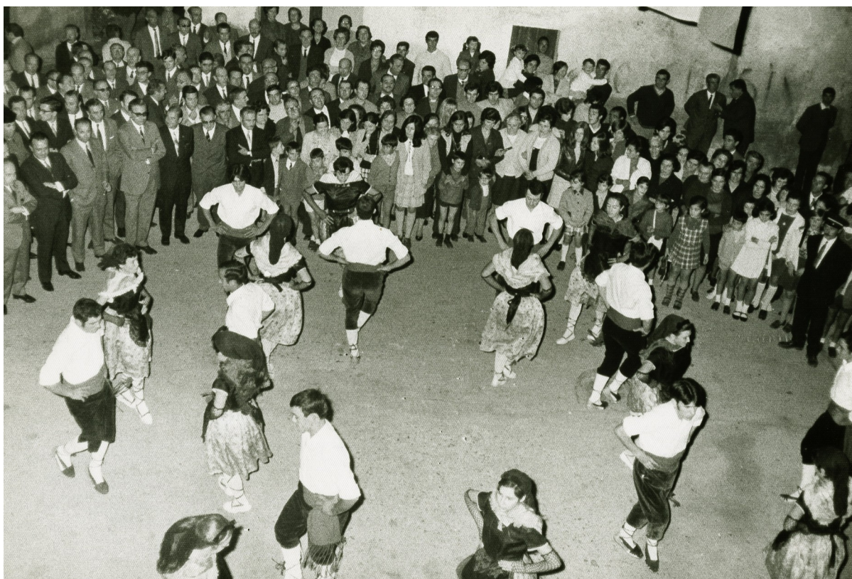
L'Àlbum de l'Arxiu 08. Dia de la Comarca de 1970 a l'Aleixar. Autor Chinchilla