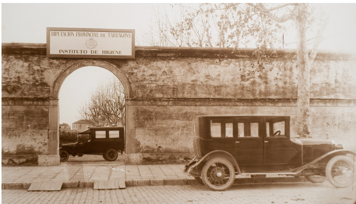
Fotografia del primer terç del segle XX que apareix a l'audiovisual sobre la Grip de 1918. AF 2702. Autor Vallvé.

9 de juny. Publicació de l'audiovisual sobre la Grip de 1918, amb motiu del Dia Internacional dels Arxius. https://youtu.be/EIjrfTKvyxo