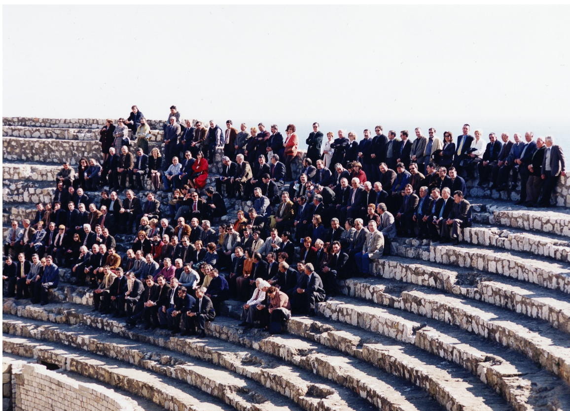
Fotografia cedida per al documental dels 20 anys de Tarragona Patrimoni de la Humanitat. Alcaldes donant suport a la campanya. 28 de febrer de 1998. Autor desconegut