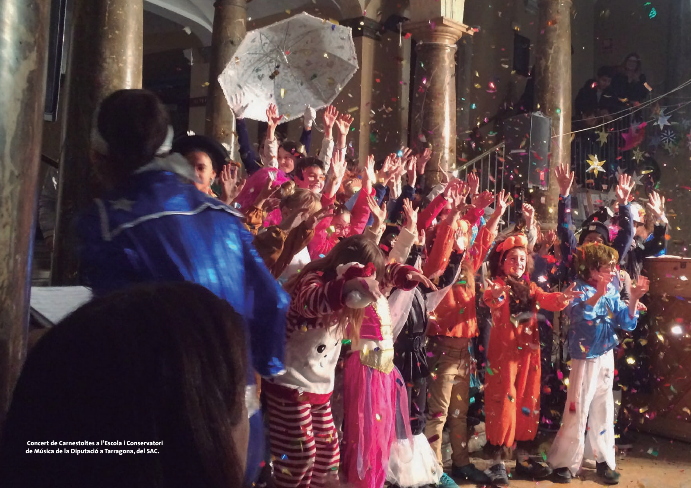
Concert de Carnestoltes a l'Escola i Conservatori de Música de la Diputació a Tarragona, del SAC.