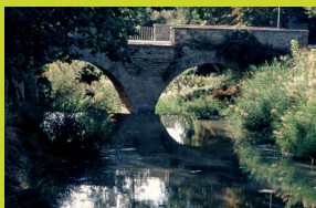
Conca de Barberà